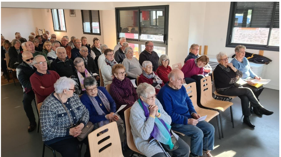
Assemblée Générale du 28 janvier 2023 salle Multi activités de LACAPELLE DEL FRAISSE